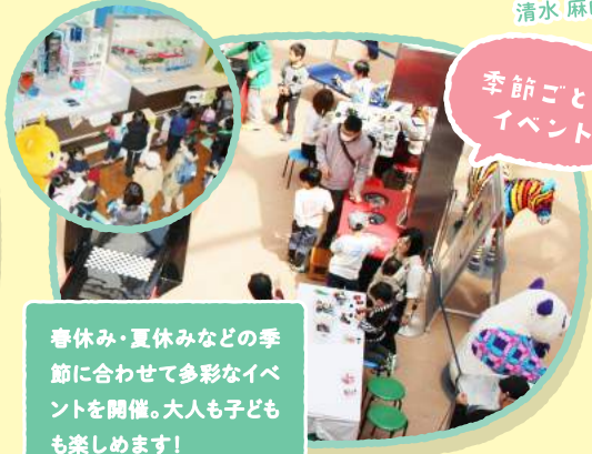
季節ごとの イベント

原子炉や防波壁の実物大模型 は必見！ 海拔62mの展望台か らは、発電所や遠州灘など周辺 の美しい自然を一望できます。