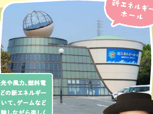
新エネルギー ホール

地元特産のお土産やお菓子などを販売しています。 特にオススメは、ソフトクリーム！バスの添乗員さんや ガイドさんにも大人気なんです。おいしさのヒミツは、 濃〜いミルクを使っているから。ぜひ、お試しください。