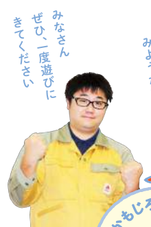
みなさん ぜひ一度遊びに きてください