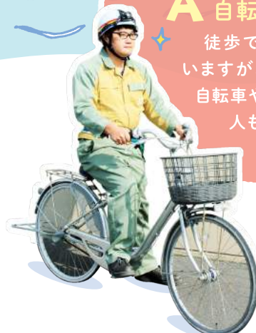
自転車だと、 いい運動に なるかも！

A 自転車や構内バスで 徒歩で移動する人ももちろん いますが、これほどの広さです。 自転車や構内バスで移動する 人もいます。