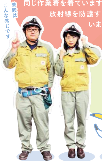
普段は こんな感じです

A 作業着です Usa みなさんが街で見かける中部電力の社員と 同じ作業着を着ています。必要な時だけ、 放射線を防護する服に着替えて います。